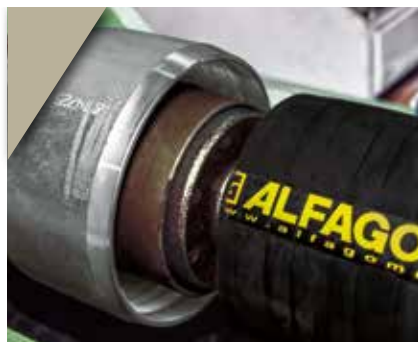
4. Inserção do terminal na mangueira