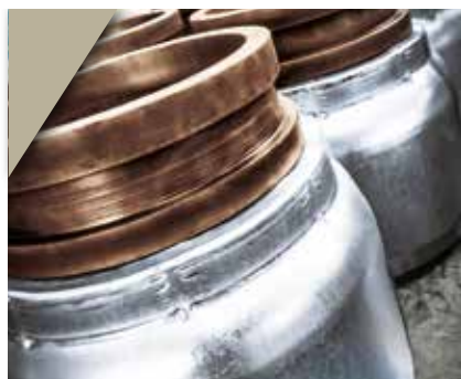
1. Terminal pré-crimpado: manuseio e crimpagem fácil e rápida