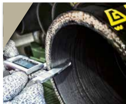
3. A espessura da mangueira é aferida para obter a calibragem do diâmetro correto para a crimpagem