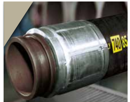
6. Tuyau équipé