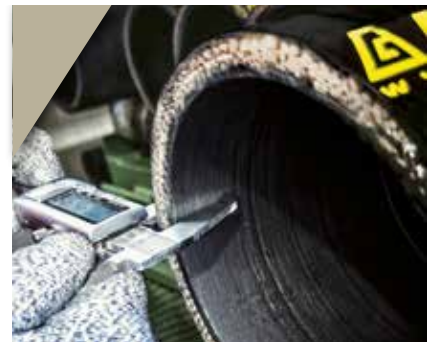
3. L'épaisseur du tuyau est mesurée pour obtenir le correct diamètre de sertissage