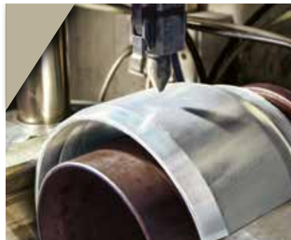
2. Possibilité de marquage de la douille pour une traçabilité complète