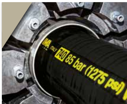
5. Operação de crimpagem